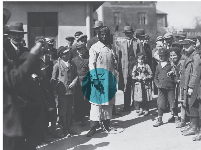
Siuda Baba, regionalny zwyczaj wielkanocny w Wieliczce, 1935 r., Narodowe Archiwum Cyfrowe

Zastanów się, czy w Twoim najbliższym otoczeniu znajdują się jakieś działające lub nieczynne zakłady przemysłowe – np. fabryka porcelany albo wókiennicza, kopalnia, huta... Historia przemysłu to doskonały pretekst do tego, aby opowiedzieć o tym, jaki był wpływ przemysłu na rozwój miasta lub regionu i jaka jest jego sytuacja obecnie. Może warto przypomnieć jakieś postacie związane z takim zakładem – inżynierów, projektantów lub pracowników? Może ktoś z Twojej rodziny w nim pracował i mógłby o tym opowiedzieć? Kiedy planujesz wydarzenie, pamiętaj, by patrzeć na zjawiska możliwe szeroko i opowiadać o wszystkich aspektach z nim związanych, nawet jeśli są trudne.