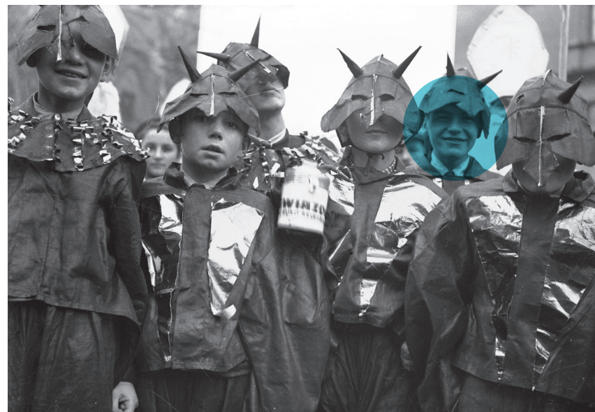
Młodzi kvestarze przebrani za diabły podczas zbiórki pieniędzy dla dzieci bezrobotnych w Krakowie, 1938 r.