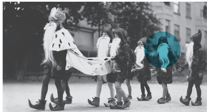
Dzieci przebrane za krasnoludki podczas parady z okazji Święta Wiosny w Krakowie, 1935 r., Narodowe Archiwum Cyfrowe

Trzeba pamiętać, że dorośli to grupa niejednorodna, mająca bardzo różne zainteresowania, warto więc eksperymentować z tematami czy formami. Sprawdzą się np. wykład, warsztaty, w trakcie których można poznać innych i rozwinąć praktyczne umiejętności, pokaz filmu z dyskusją czy spacer. Możemy promować działania w mediach społecznościowych, grupach tematycznych lub przy okazji wydarzeń dla najmłodszych.