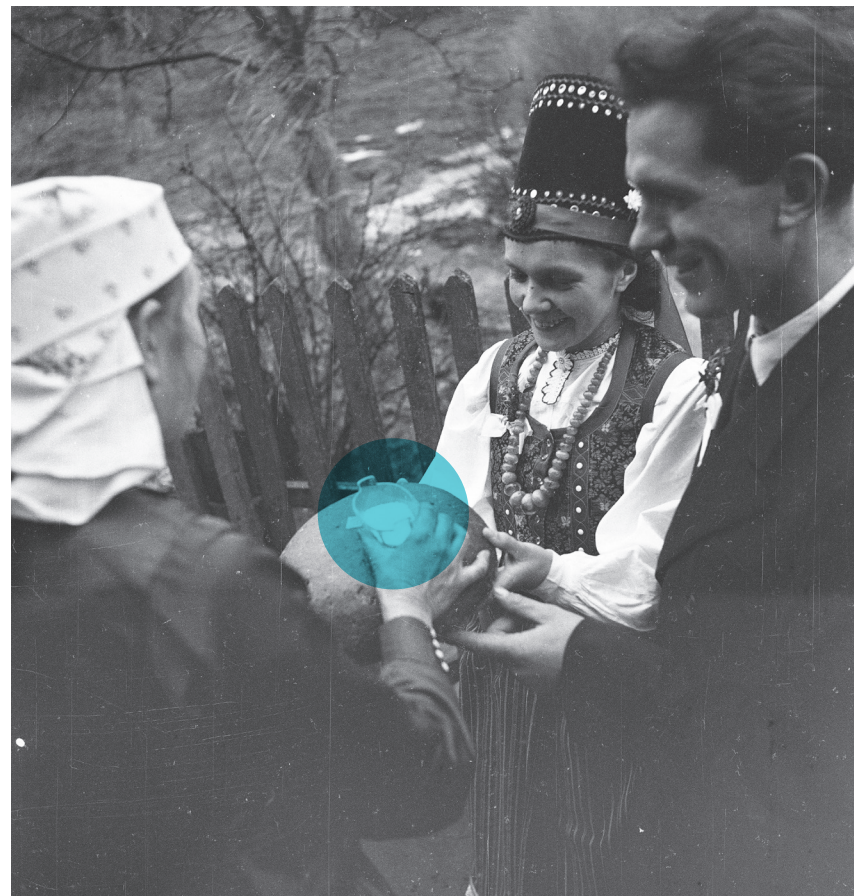
Uroczystość zaślubin w Kadzidle na Kurpiach, 1953–1963 r.

Decyzja o organizacji wydarzenia w ramach EDD jest oddolna, a organizatorami działań są muzea, które najczęściej mają pod opieką obiekty zabytkowe, a także lokalne ośrodki kultury, biblioteki, urzędy gmin, organizacje pozarządowe, parafie – podmioty, dla których popularyzacja lokalnego dziedzictwa jest ważna i które