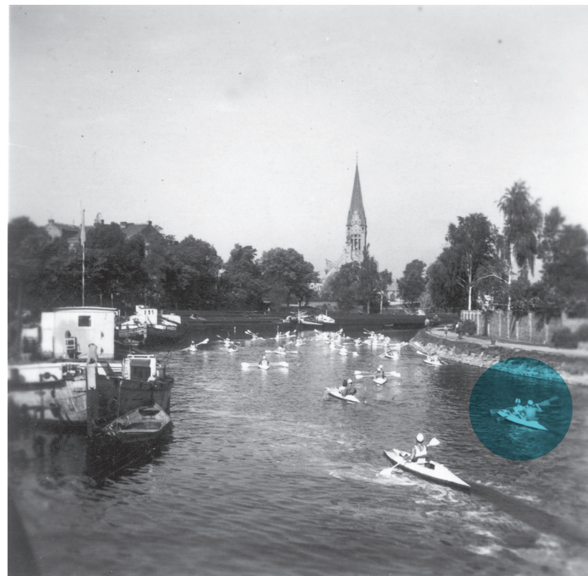
Brda w pobliżu Mostu Bernardyńskiego w Bydgoszczy, 1935 r.

Nawet z pozoru oczywisty temat można przedstawić z nowej perspektywy. Przemysł kojarzony jest na ogół jako męska domena, ale Fundacja Dobra Wola z Cieszyna postanowiła przyrzeć się roli kobiet w rewolucji przemysłowej na Śląsku Cieszyńskim. Po pierwszej wojnie światowej, z powodu poboru mężczyzn do wojny, wiele kobiet podejmowało pracę w fabrykach i zakładach przemysłu lekkiego i ciężkiego. Dziś już mało kto o tym pamięta. Autorki filmu „Żywobyci przy granicy. Babskie godki o robocie we werkach” zorganizowały jego pokaz połączony z dyskusją, w trakcie którego przedstawiły opowieści kobiet pracujących w zakładach przemysłowych kilkadziesiąt lat temu, ale i współcześnie, po obu stronach granicy.