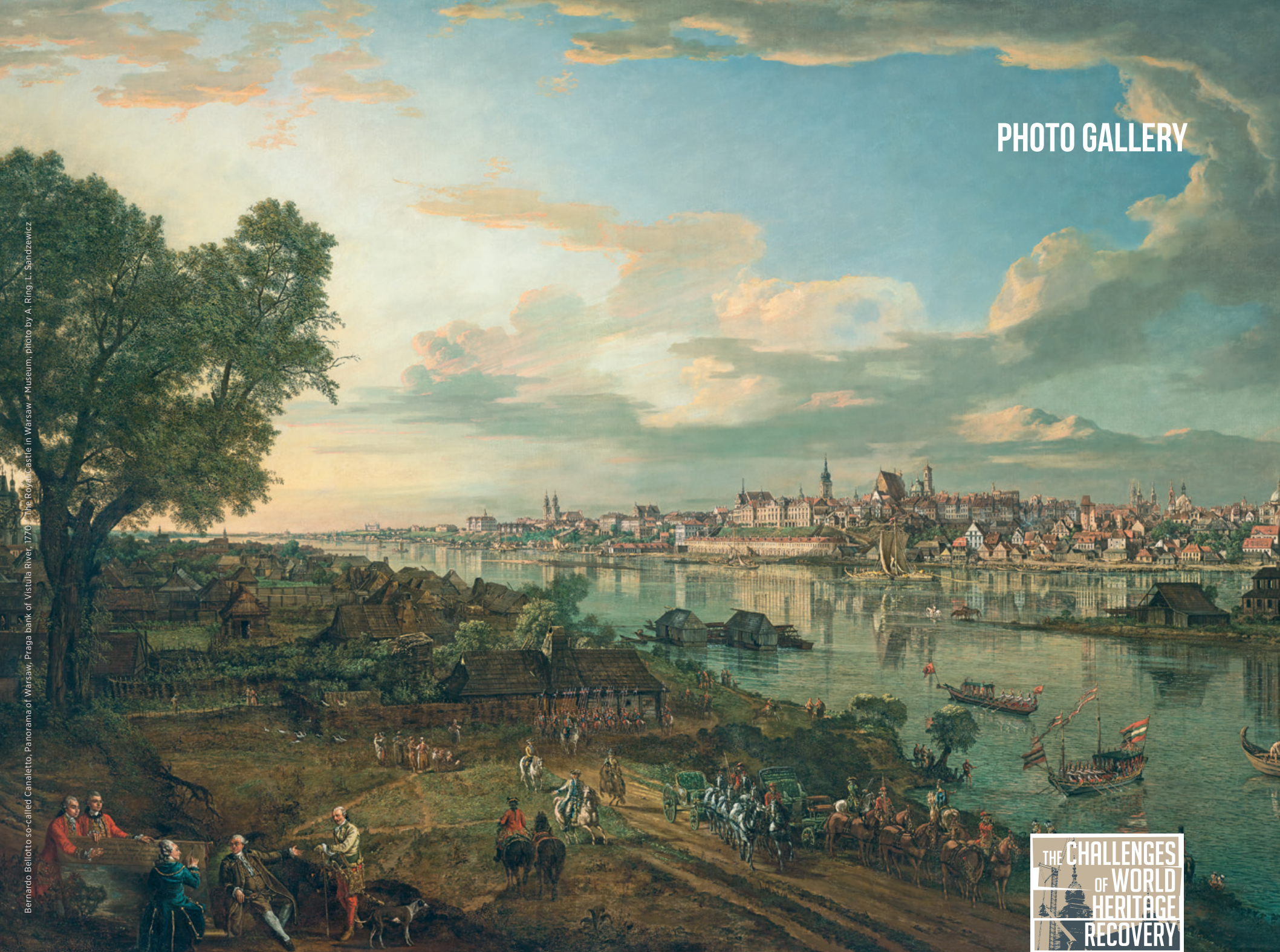
Bernardo Bellotto so-called Canaletto, Panorama of Warsaw, Praga bank of Vistula River, 1770. The Royal Castle in Warsaw - Museum, photo by A. Ring, L. Sandziewicz

THE CHALLENGES OF WORLD HERITAGE RECOVERY